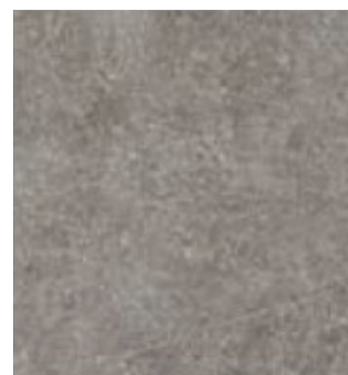
Struktur Ljus 590